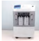
Aspirateur électrique Prix: --- USD