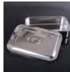
Boite à pinces Prix: --- USD