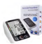
Tensiomètre électrique Prix: --- USD