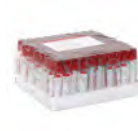
Tubes à prélèvement Prix: --- USD