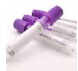
Tubes à prélèvement Prix: --- USD