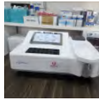
Spectropho tometre Prix: --- USD