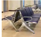
Salle d'attente Prix: --- USD