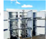
Morgue Prix: --- USD