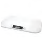
Pèse bébé Prix: --- USD