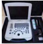
Appareil échographie Prix: --- USD