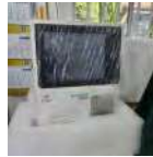
Automate hématologie Prix: --- USD