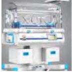
Couveuse Prix: --- USD