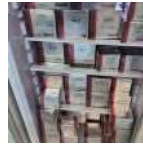
Réactif de biochimie Prix: --- USD