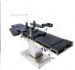
Table Opératoire Prix: --- USD