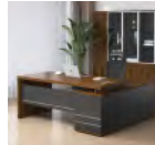
Bureau Prix: --- USD