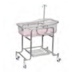
Berceau Prix: --- USD