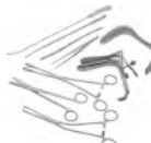
Pinces Prix: --- USD