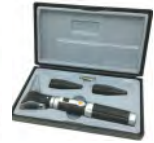
Otoscope Prix: --- USD