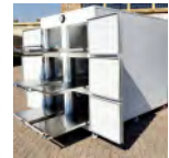
Morgue Prix: --- USD