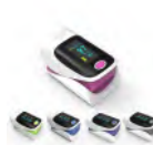
Oxymètre Prix: --- USD