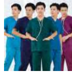
Blouson médicales Prix: --- USD